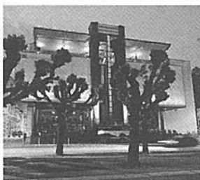
Luogo o non luogo?

olus? Magari. no ha deciso luogo a pro- zio trasmesso so aprile. La de l'annulla- l'abbandono ratore Zacca- a un decreto mazione (ed innia).