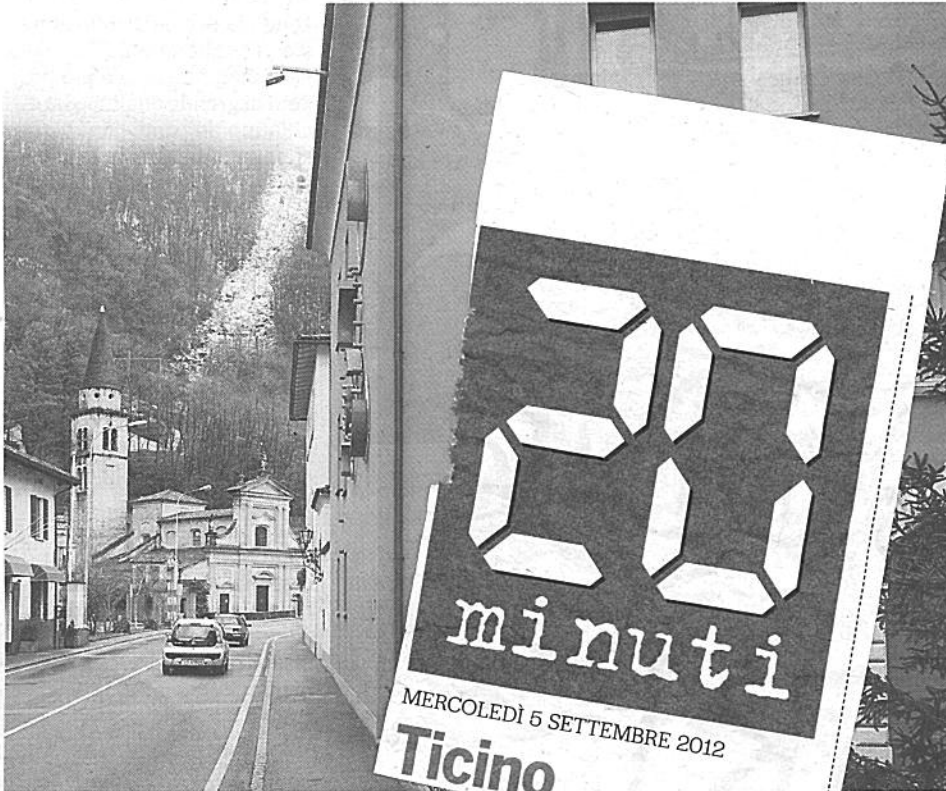
La velocità massima rilevata è stata di 105 chilometri orari.

tere al cor- ne del fatto ano a velo- reazione del